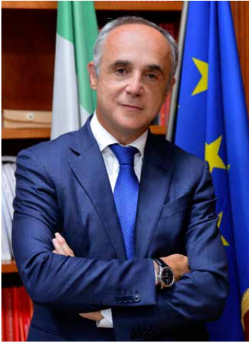
Michele Scannavini Presidente Agenzia ICE

L' Italia è il primo esportatore mondiale di mobili di lusso: un'altra parte importante di Made in Italy apprezzata in tutto il mondo. Per conoscere e ammirare i mobili e il sistema dell'arredo italiano bisogna, però, sapersi orientare nella grande varietà che caratterizza questa offerta: luogo di produzione, stile di riferimento, tecniche impiegate che, nel caso dell'Italia, possono variare moltissimo a seconda delle località.